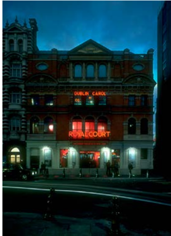
Haworth Tompkins, Royal Court Theatre, Londres.