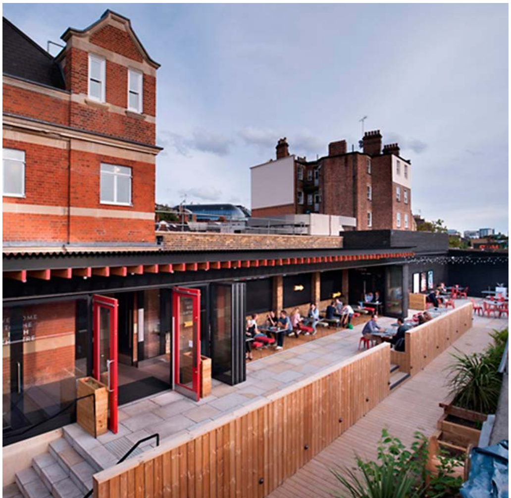
Haworth Tompkins, Bush Theatre, Londres.

Els vestíbuls s'entenen aquí com l'extensió del carrer, no només quant a materials sinó també quant a temps: estan disposats en un cert ordre cronològic que conceptualment els converteix en un punt de pas entre la vida de cada dia del carrer i una zona més sòlida, permanent i arrecerada. La capa exterior té a veure amb els ritmes ràpids de la realitat. Per aquest motiu, aquesta qualitat porosa és clau.