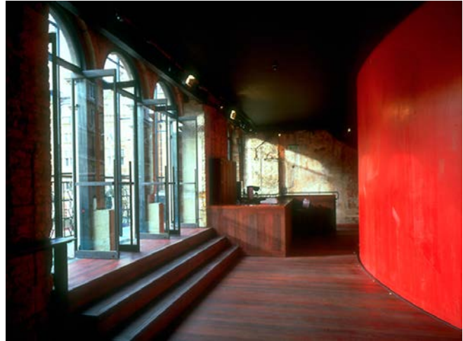
Haworth Tompkins, Royal Court Theatre, Londres.