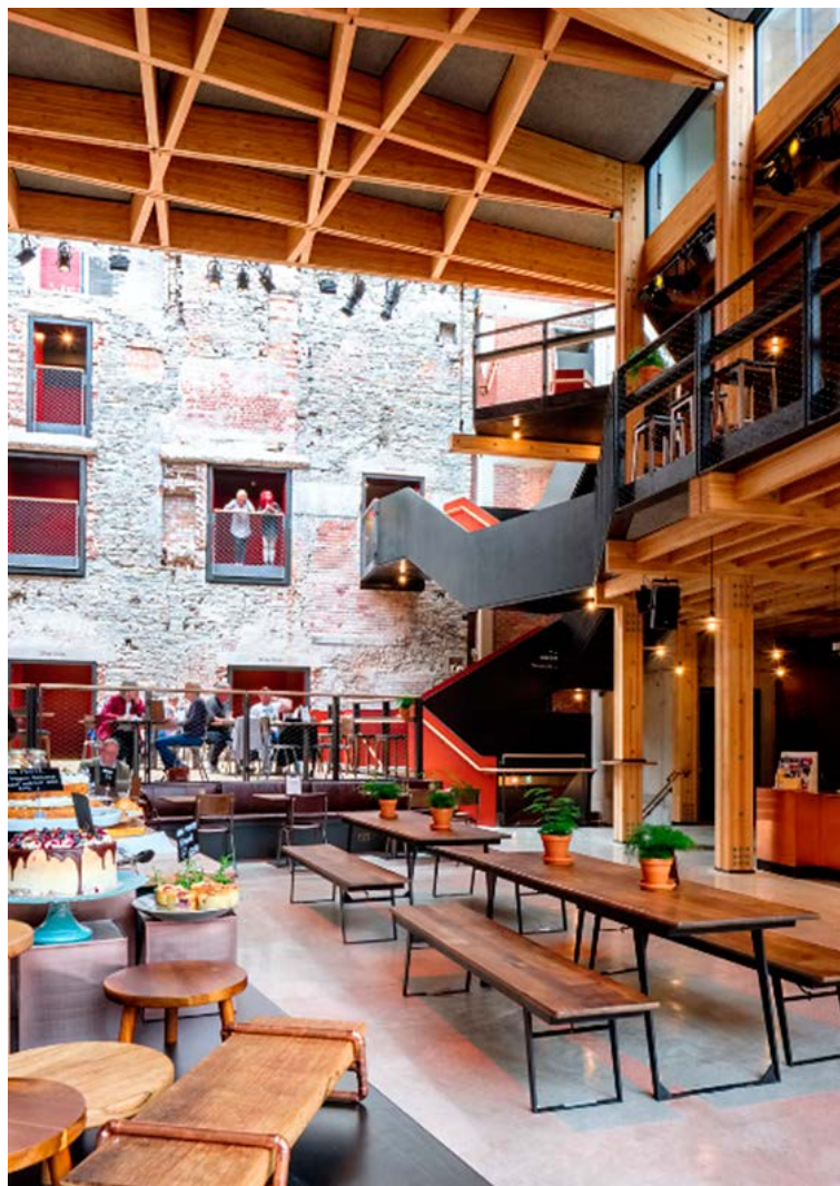
Haworth Tompkins, Bristol Old Vic, Bristol © Philip Vile.

intervenció va implicar l'enderroc complet i la substitució de del vestíbul i la sala del teatre en el cas del Bristol Old Vic —de mitjans dels anys setanta— i convertir-la en una nova esplanada coberta i lluminosa en continuïtat amb el carrer i, en el cas del Battersea Arts Centre, tornar a emmarcar la Sala Gran danyada per un incendi junt amb ajustaments i afegitons pràcticament invisibles i eliminar elements en altres parts.