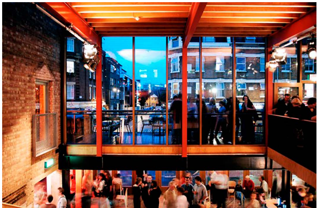
Haworth Tompkins, Young Vic Theatre, Londres.