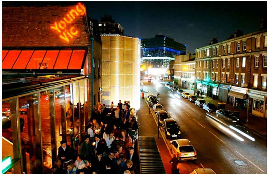
Haworth Tompkins, Young Vic Theatre, Londres.

Aquest aspecte és evident en projectes que renoven antics teatres de diferents tipus: alguns «espais trobats» com el Young Vic Theatre o teatres que ja existien com el Bristol Old Vic o el National Theatre.