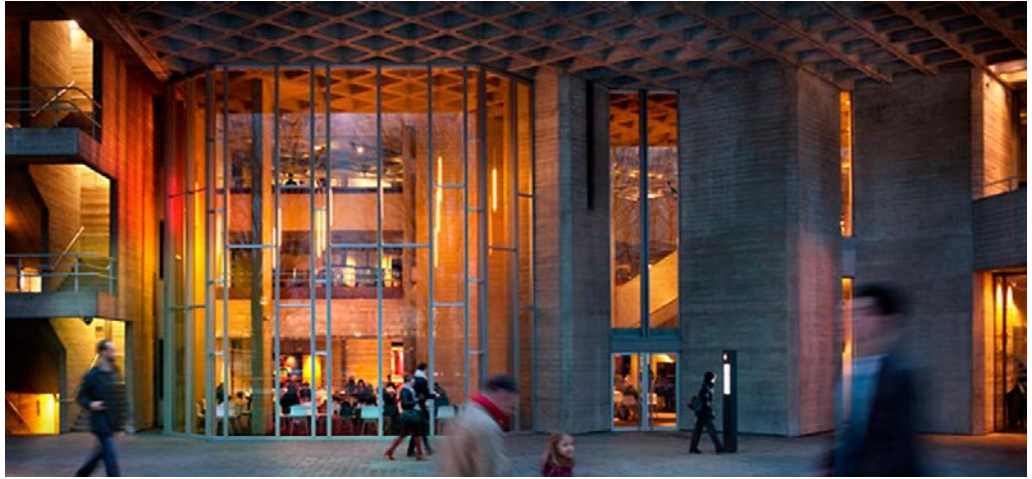
Haworth Tompkins, National Theatre, Londres ©Philip Vile.