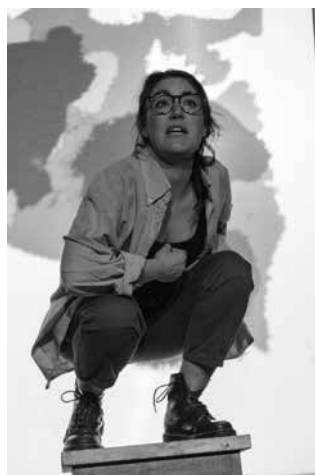
País sense paraules . Dea Loher. 2013.