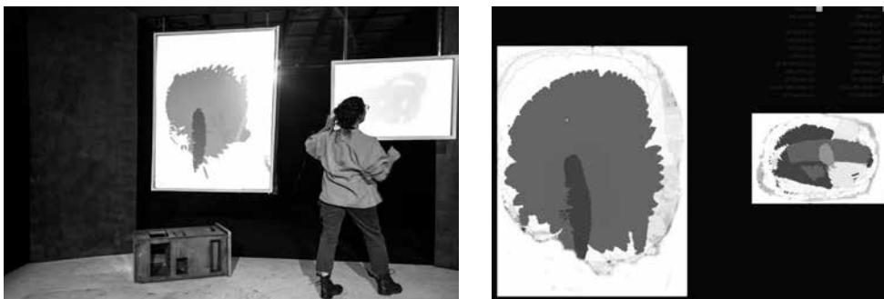
País sense paraules . Dea Loher. 2013. «Aquí hi ha una petúnia i allà un crani d'animal mort amb banyes».

Del text, es desprenen conceptes relacionats amb l'art de Rothko. La posada en escena permet, en primer lloc, que els llenços sumin capes que emulen les pintures de l'artista i, en segon lloc, que l'ús dels colors, de la llum i dels traços abstractes facin referència tant a la tècnica com a l'exploració de Rothko.