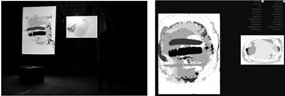
País sense paraules . Dea Loher. 2013. «Que una línia prima de color groc sostingui per la vora inferior i per la vora superior una de vermella una mica més ampla.»

el seu dolor. Les situacions que ha viscut es barregen de tal manera que el seu estudi es converteix en un recipient de records. Dos llenços –dues pantalles interactives que detecten el gest i la pressió de les mans sobre la tela– permeten pintar-hi i fan de suport de les imatges que la protagonista genera mentre busca una sortida al seu bloqueig. El text se situa en un present en què la recerca succeeix en el mateix moment gràcies a la tecnologia, que permet pintar i repintar.