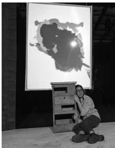
País sense paraules . Dea Loher. 2013.

Segons la traductora del text de Dea Loher de l'alemany al català, la figura d'una pintora europea enmig d'una ciutat devastada per la guerra i anomenada K (probablement Kabul) suggereix, d'entrada, que el concepte de frontera és eludible. A la vegada, analitzar els límits de l'obra comporta inevitablement pensar en la premissa «els límits del meu llenguatge són els límits del meu món» (Wittgenstein, 1989: 130) i preguntar-se tot seguit si «s'haurien de buscar en un país sense paraules» (Pago, 2012).