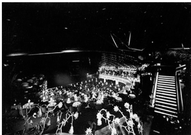
Tito's, ca. 1970.

Tot i l'absència de teatres a l'Eixample de Palma, tal vegada pel fet que són les classes populars les que habitaren aquesta nova àrea de la ciutat fora murades, hi ha una excepció prou significativa: La Casa del Poble (1924-1936), el teatre per a les associacions obreres projectat per Guillem Forteza. L'associacionisme, en el vessant social i polític més que artístic, també va fomentar l'aparició d'una sèrie de nous espais disseminats per la ciutat. Es tracta d'associacions com La Protectora (1886-tancat), el Teatre Mar i Terra (1898-...) —de l'arquitecte Josep Segura—, l'Assistència Palmesana (1901-tancat); el Cercle d'Obrers Catòlics (1878-1929) —posterior Saló Mallorca (1931-1937)— o el Foment del Civisme o Saló de Belles Arts (1925-1934).