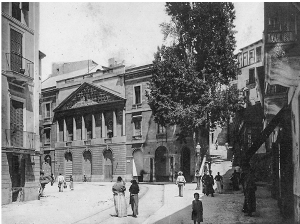
Teatre Principal, ca. 1880.