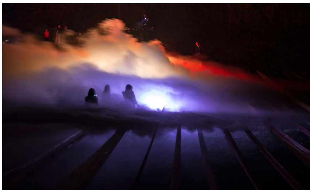
Lluèrnia 2015 Foto: Santi Palomé / Cràter – Xavi Bayona Camó.

Des de l'inici, Lluèrnia s'ha ofert com un entorn real on poder mostrar el treball dels alumnes d'arquitectura, de les escoles d'art i disseny, dels màsters d'il·luminació de les diverses universitats, i de qualsevol altra disciplina com l'escenografia o la creació efímera, relacionades amb el foc i la llum.