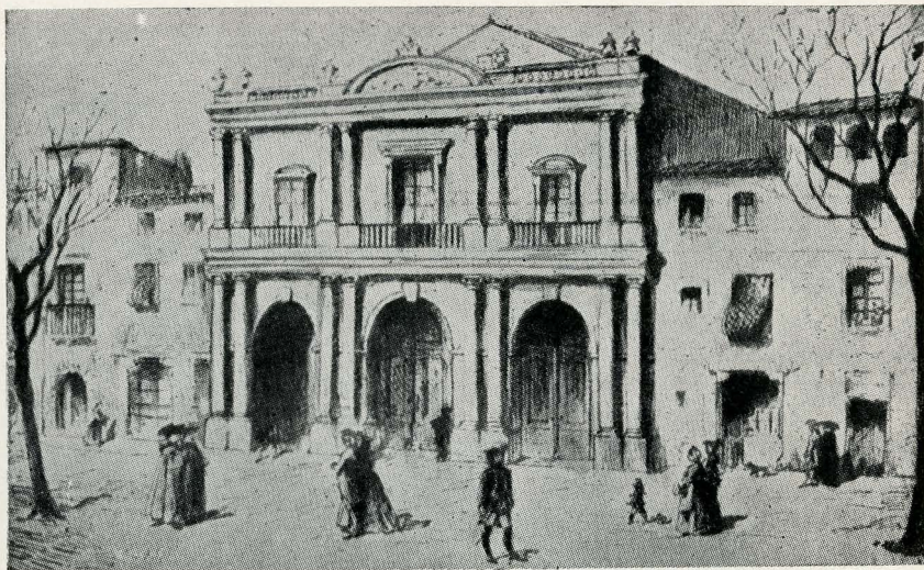
El Teatro de la Ciudad, tal como era a principios del siglo xviii.