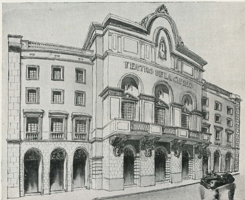
Reconstrucción ideal de la fachada del Teatro Principal.