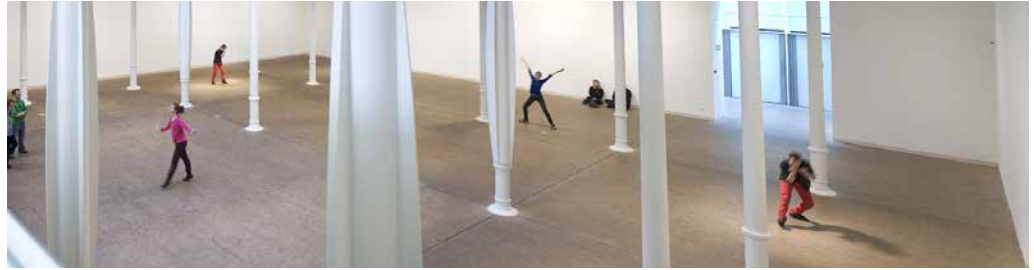
Retrospectiva de Xavier Le Roy (Fundació Tàpies, Barcelona, 2012).