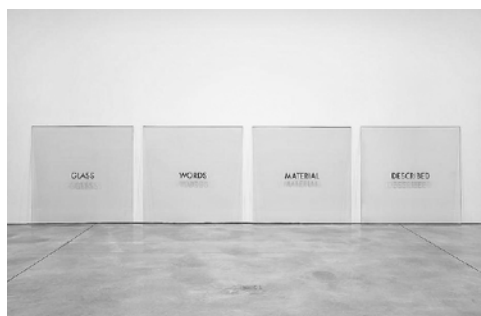
Glass Words Material Described , de Joseph Kosuth (1965). © Joseph Kosuth

un nuevo empuje a través de nociones como concepto o discurso. Dentro de lo que se ha conocido como el giro discursivo de las artes, el aparato expositivo se reconfigura en torno al signo como un espacio fundamentalmente lingüístico. 7 En este sentido, el fortalecimiento de las posiciones comisariales en la década de los sesenta y de las estrategias conceptuales de los setenta habrían revitalizado el arte como el relato del arte, enfatizando lo que con Mijaíl Bajtín podríamos denominar el ámbito general de las declaraciones o los enunciados. Como apunta Paul O'Neill, en este contexto, las exposiciones se empiezan a percibir como poderosas herramientas de subjetivación con las que actuar en el dominio de los discursos, relanzando los modelos semióticos y arqueológicos de la exposición (O'Neill, 2012: 10; trad. 2012).