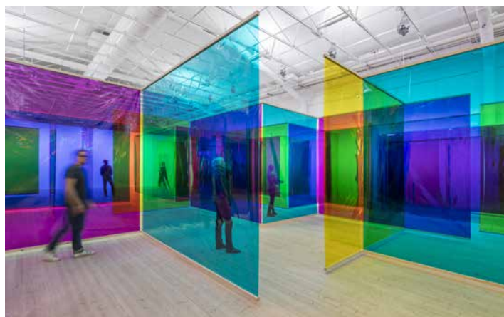
Your body of work , de Olafur Eliasson (Moderna Museet, 2015).

La adopción totalizante de la noción de audiencia en el campo del arte implica una indistinción sustancial entre los agentes y los medios de la exposición —artistas, comisarios, públicos, etc.—: un campo de intermediaciones reducido a la norma de la interacción permanente en un entorno artificial y controlado según el modelo del panóptico digital (Han, 2012; trad. 2013). O, en otros términos, una musealización de la existencia (Marchán Fiz, 2008: 138-157) a través de la extensión de sistemas de vitrinaje y contenerización (Flórez, 2014), que procesan la vida de forma inmediata en el instante de su ejecución. En este sentido, muchas de las exposiciones de live art empiezan a funcionar como interfaces que conectan y optimizan la vivencia de la audiencia dentro de un entorno panóptico hiperconectado.