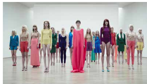
VB68 , de Vanessa Beecroft (Museum für Moderne Kunst, 2011). © Vanessa Beecroft

Estas cuatro escenas ponen de relieve lo que podríamos llamar el vocabulario de lo performativo en la exposición y los modelos de eficacia que vienen a encontrarse en el museo vivo como parque temático de la humanidad. Un espacio diseñado de acuerdo a formas de interacción inmediatas —donde las mediaciones tienden a su supresión a través de la transparencia del