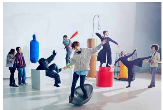
Move. Choreographing You (Hayward Gallery, Londres, 2010). © Fredrik Nilsen