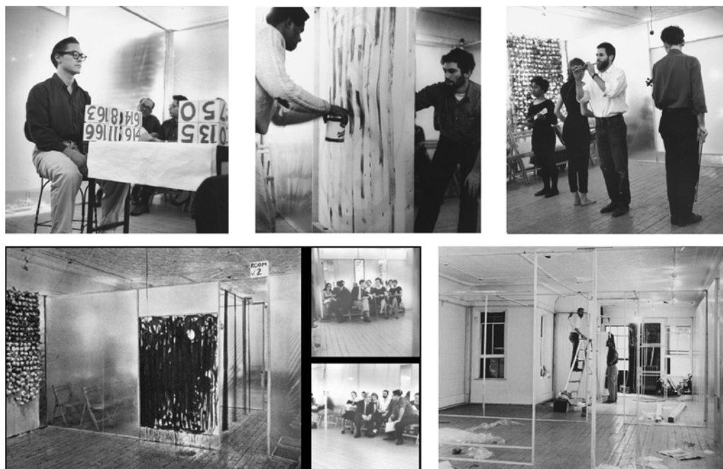
18 Happenings in Six Parts , de Allan Kaprow (Reuben Gallery, Nueva York, 1959).

reconfiguran la exposición según lógicas temporales y desmaterializadas — en el caso del performance art y los happenings —, las lógicas ambientales y procesuales —en el caso de los environments y las instalaciones— o incluso, las lógicas participativas a través de muchas de las actividades del Fluxus.