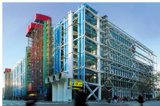
Centro Georges Pompidou, París, de Piano y Rogers, 1977. © Centro Georges Pompidou

que ver con la (re)producción humana. Este problema ha sido retomado como el problema de los humanismos por Peter Sloterdijk en Normas para el parque temático de la humanidad: Una respuesta a la «Carta sobre el humanismo» de Heidegger , y también por Derrida en Mal de archivo . En cualquier caso, aquí la cuestión del aquello que pueda decir nosotros es, sobre todo, la cuestión del mundo: de su reproducción, de su sostén y de su renovación.