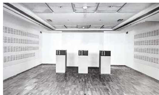
Index 2 (III) , Art & Language (Documenta V, 1972).

El movimiento decisivo de este giro pasa por concebir la colección en clave de archivo, en la medida en que el archivo desjerarquiza el corpus de la historia del arte, haciendo saltar el orden bibliotecario de la tradición. La noción de archivo permite revelar el presupuesto etnocéntrico de la colección y las estructuras de poder que han configurado la disciplina de la historia del arte y del museo moderno, a través de la determinación de la performatividad del gesto archivador (Derrida, 1995: 24; trad. 1997). De acuerdo a estas ideas, la new museology y la crítica institucional consolidan las narrativas de la diferencia apoyándose en la deconstrucción derridiana. Desde esta perspectiva, el recurso a los re-enactments dentro del marco cultural de las artes vivas participa del entusiasmo generalizado respecto a los modelos arqueológicos y los procesos de actualización que revelan las posibilidades inscritas en los archivos y en los repertorios culturales 8 (Lepecki, 2010: 63-84; trad. 2013).