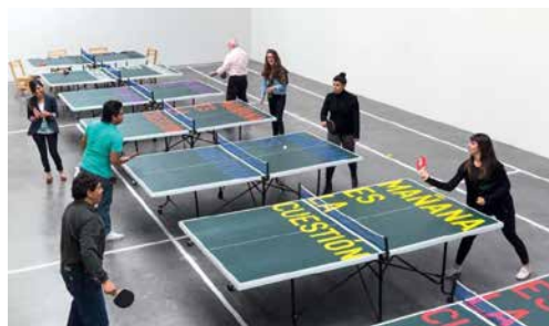
Universal Fantastic Occupation , de Július Koller y Rirkrit Tiravanija (Centro Pompidou, 2015).

La sociología del arte de Bourriaud contrasta con las visiones que definen el arte como espacio ficcional que juega activamente con formas de visibilidad y enunciación para reconfigurar los repartos de lo sensible. Desde esas latitudes le han llovido fuertes críticas a la escena relacional. Una de las más explícitas es la que formula Jacques Rancière, al señalar que muchas prácticas relacionales no solo están basadas en un orden consensual de la política —y por tanto policial y conservador, según los términos del autor—, sino que además en virtud de una lógica archiética identifican y suprimen al mismo tiempo las formas del arte y las formas de la política (Rancière, 2004: 59-78; trad. 2004). Las consideraciones de Rancière llaman la atención sobre la forma en que la escena relacional define el arte directamente como un modo de producción social, abogando por la efectividad de la forma artística y suprimiendo la potencia mediadora de la ficción. 10