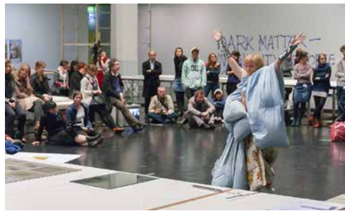
Moments: A History of Performance in Ten Acts (ZKM, Karlsruhe, 2012).