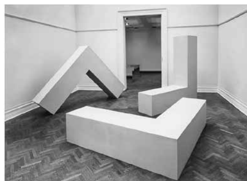
One-person exhibition , de Robert Morris (Green Gallery, Nueva York, 1964). © Robert Morris / Artists Rights Society