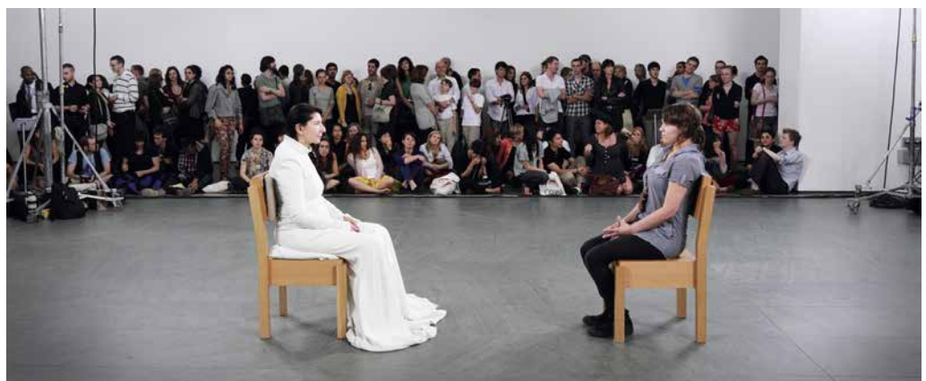
The Artist is Present, de Marina Abramović (MoMA, 2010).