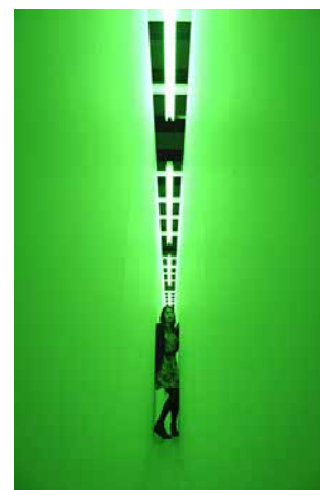
Green Light Corridor , de Bruce Nauman en Move: Choreographing You (Hayward Gallery, Londres, 2010).

Si volvemos de nuevo al campo de las exposiciones de live art , creo que ya estamos en condiciones de entender por qué, en la nueva configuración antropotécnica de la época global, la maquinaria del museo salta del mausoleo al parque temático. Como hemos visto, las exposiciones de artes vivas no solo asimilan todos los giros posmodernos de la exposición, sino que también cristalizan la emergencia del paradigma del museo vivo, donde la exposición se empieza a percibir como un espacio de procesamiento energético, corpóreo, subjetivo y organizativo de las relaciones sociales, a través de una noción des-limitada de audiencia.