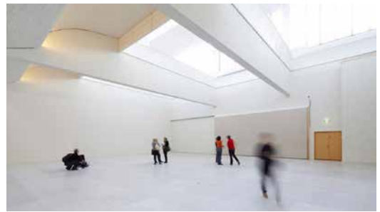
This Success or This Failure , de Tino Sehgal (Kunsten Museum of Modern Art, 2007). © Tino Sehgal