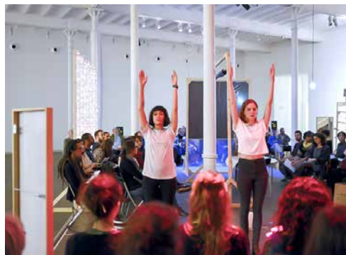
Allan Kaprow. Altres maneres (Fundació Tàpies, 2013).