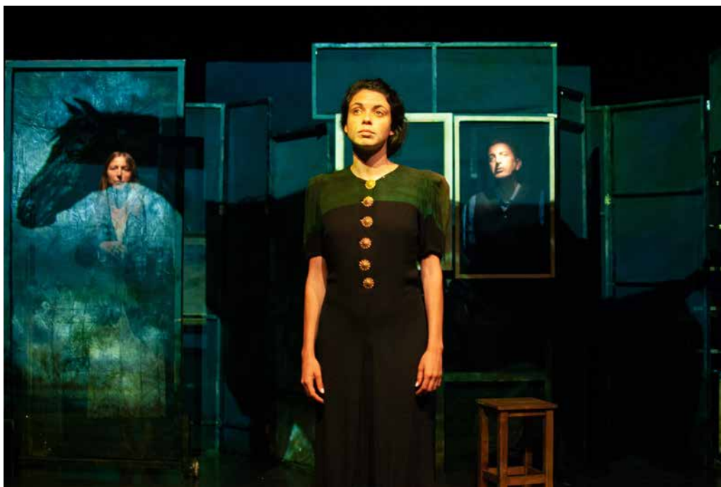
Fig. 3. Una escena de l'obra Fils de vida , estrenada al Teatre del Mar el juliol del 2021.

El teatre té el poder de recuperar les ànimes perdudes i de tornar la veu als morts. Potser aquesta sigui una de les claus per poder construir el present amb honestat i justícia. (Programa de l'espectacle) 14