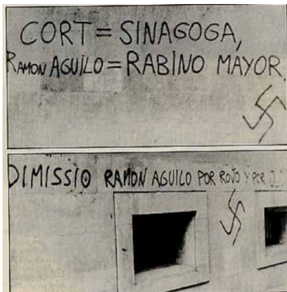
Fig. 2. Pintades contra el batlle Ramon Aguiló, fent al·lusió al seu llinatge xueta i a la seva pertinença al PSOE. (Arxiu de l'Última Hora).

que fou rebuda amb grafitis en algunes façanes de l'antic Call («Holocausto, mentira judía»). (vegeu la imatge anterior).