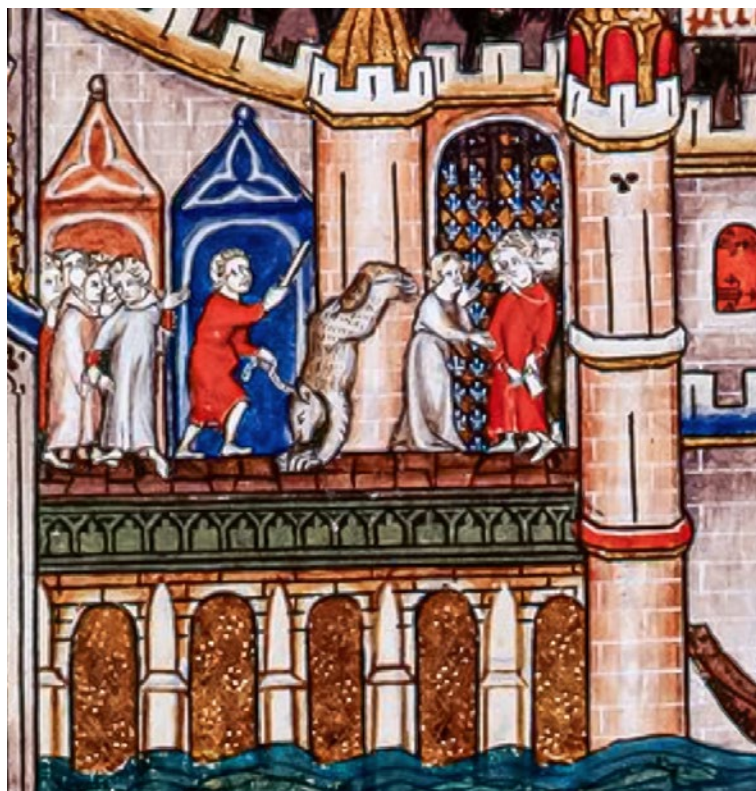
Figura 3. Espectacle de circ amb ossos en un pont de París, cap al 1317 (Bnf, ms. Fr., 20091, fol. 47).

petits instants de relació entre els homes i els animals que també es veien a les processons i altres desfilades religioses. Els testimonis il·lustrats són freqüents, com per exemple aquell ensinistrador d'ossos que es veu fent fer acrobàcies al seu animal davant la sorpresa i l'admiració de la gent, al bell mig d'un dels ponts de París (fig. 3) en un manuscrit de la vida de sant Dionís, de 1317 (París, BNF, ms. Fr. 20091, fol. 47).