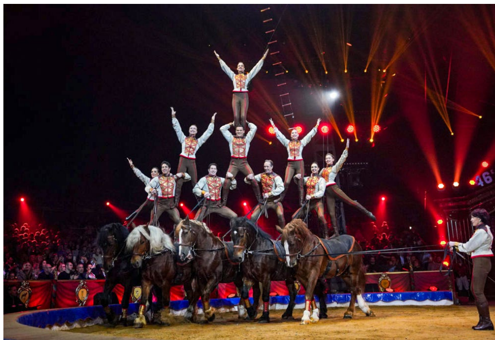
Figura 13. L'espectacular piràmide sobre cavalls de la família Gruss, Festival de circ de Montecarlo, 2024.

Hi ha qui considera que els lleons, les panteres i els tigres són l'essència mateixa del circ i que l'ofici de domador és el més potent de la història d'aquesta art escènica. Hi ha prou literatura al respecte, llibres de memòries i manuals d'ensinistrament escrits per domadors cèlebres. El domador de bèsties salvatges és, com el porter de futbol, un personatge singular. El 1903, el cèlebre domador britànic Frank C. Bostock (1866-1912) pretenia que els riscos del domador no eren més perillosos que els d'un metge que pot encomanar-se una malaltia o que els d'un soldat que, quan entra en batalla, no pensa que pot morir, i explicava que el domador té tanta por com els homes ordinaris davant del perill, només que està entrenat per a fer-hi front amb sang freda.