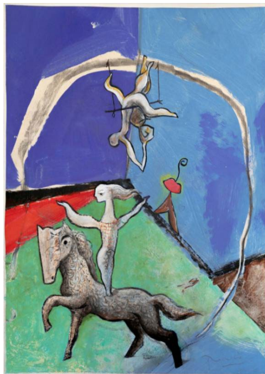
Figura 5. Josep M. Rosselló, Amazona , 2016 (col·lecció particular).

Si aquell pintor tradicional de circ, present a les carpes, ha desaparegut, és perquè el circ ha canviat, no tant la pintura. Avui l'efervescència del circ ha transformat la història d'aquest espectacle en una forta varietat de direccions. I Catalunya ha guanyat presència, aquí i a fora. Però manquen sales que programin circ, sales que el circ contemporani i els artistes més joves necessiten. El clam perquè els teatres s'obrin al circ és general. Manca encara un circ estable potent, amb arquitectura pròpia a Barcelona o en altres