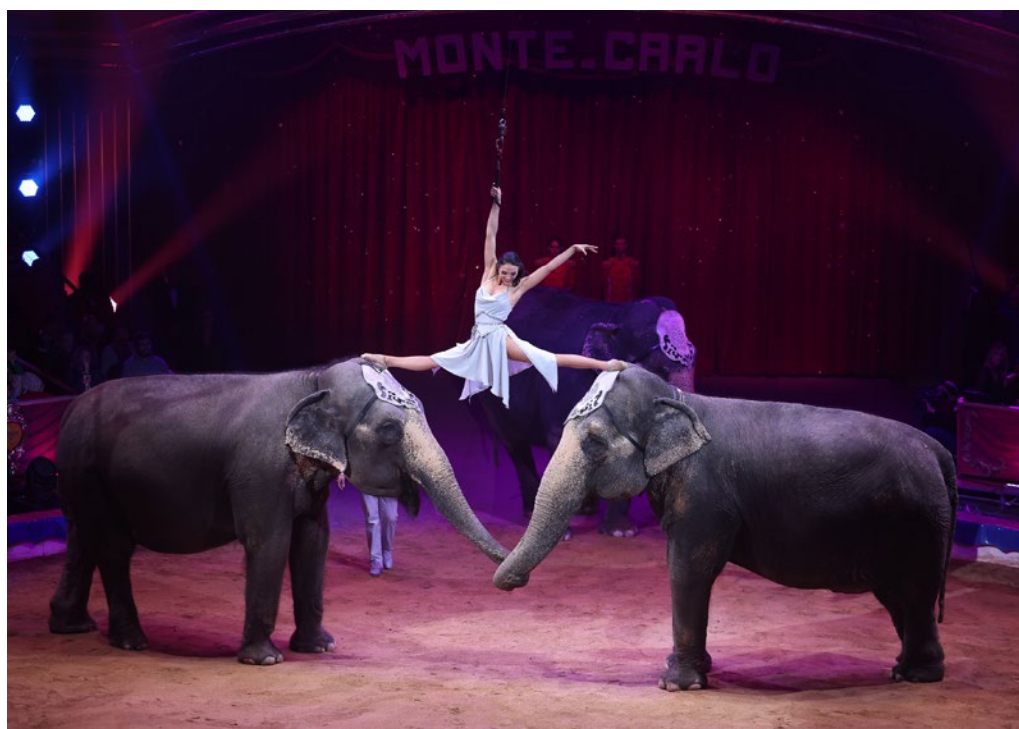
Figura 10. Els elefants de la família Errani, Festival de circ de Montecarlo, 2024.

Avui en dia, però, encara mantenen la distància. En el món geogràficament més proper a nosaltres, hi ha pocs llocs on puguin conviure plenament aquests dos models de circ. En realitat només n'hi ha un. Això només es