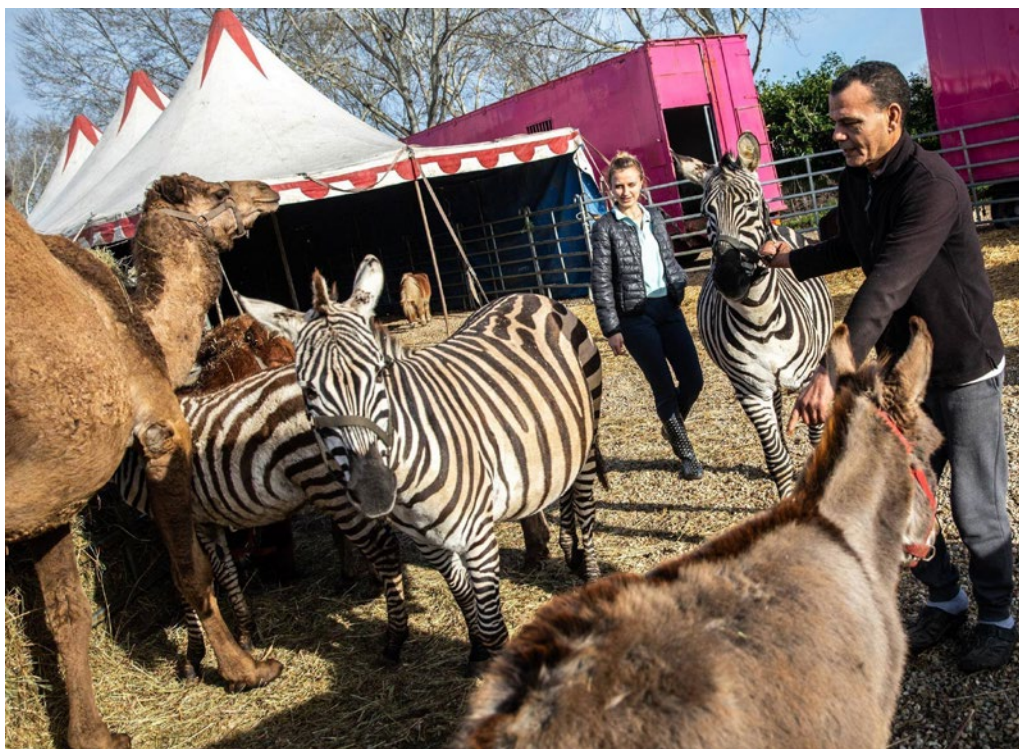
Figura 12. Imatge característica i popular dels animals del circ Medrano.

i nets, executaven números extraordinaris com la gran piràmide eqüestre amb cinc cavalls i vuit joqueis a la manera del que feien llurs avantpassats (fig. 13). La gran figura eqüestre de la família Gruss, amb vuit cavalls i onze genets i genetes, és un gran moment de l'art eqüestre, mentre les amazones acròbates fan números clàssics del circ a l'antiga que recorden les grans i famoses cavalleresses d'inicis del segle xx.