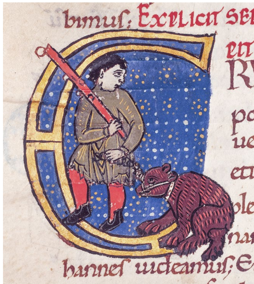
Figura 2. Joglar ensinistrador d'ossos, cap al 1120-1130 (Tours BM, ms 291, fol. 141v).

També els espectacles amb animals eren freqüents a l'Edat Mitjana, animals exòtics al servei dels més rics, o ensinistradors de feres i d'animals quotidians per distreure la gent (fig. 2.). Els carrers eren el lloc habitual d'aquests