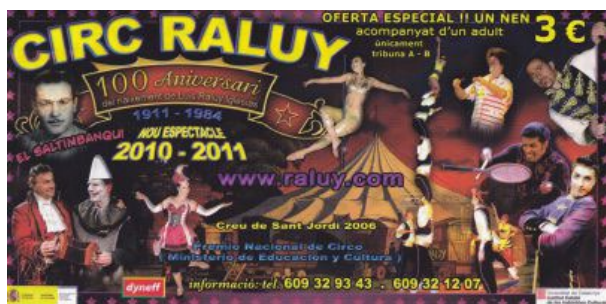
Figura 6. Circ Raluy, entrada.