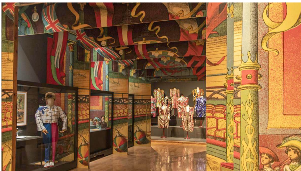
Figura 8. Circusland, museu de circ, Besalú.

Les festes de Nadal han esdevingut també a Catalunya sinònim de circ i s'ha consolidat a les famílies la tradició d'anar al circ durant aquells dies festius. Si prenc com a exemple el darrer Nadal del 2023, l'oferta sembla que