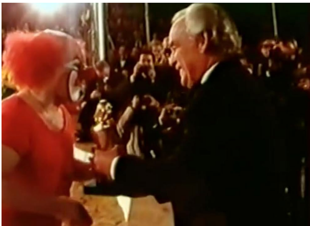
Figura 11. El príncep Rainier de Mònaco lliurant el Clown d'Or a Charlie Rivel (primera edició del Festival International du Cirque de Monte-Carlo, 1974).

¿Es pot concebre, en el 2024, el circ i la carpa sense les col·leccions d'animals i els parcs zoològics ambulants? (fig. 12). Des de l'època romana, passant per la medieval, ho he dit més amunt, els espectacles de carrer, ambulants o de distracció, basats en el que ha esdevingut el circ, s'han fet sempre amb animals ensinistrats, exòtics, aquells que la gent no veia sovint en la seva vida quotidiana o que, si eren animals de cada dia, el públic no imaginava que podien fer les coses que feien. En l'edició d'aquest any 2024, a Montecarlo s'ha volgut retre homenatge a un patriarca, Alexis Gruss, sense saber que moriria poc després, el 6 d'abril, quan estava a punt de fer vuitanta anys i a complir-se'n cinquanta de la companyia que duu el seu nom. Era i serà sempre una llegenda; ja havia estat recompensat amb el Clown d'Or en el 25è festival i aquest any ho ha estat tota la família. Ell va fer fer cabrioles al seu famós cavall D'Artagnan, mentre els nombrosos membres de la família, fills