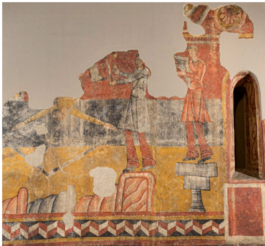
Figura 1. Els joglars romànics de Sant Joan de Boí (MNAC).

Per a mi, però, el veritable circ modern comença a l'Edat Mitjana quan joglars, equilibristes i acròbates envaïen els carrers de pobles i ciutats amb les seves proeses. Els drames litúrgics representats a les esglésies i el teatre de carrer visible damunt els pedrissos davant d'esglésies i monestirs eren